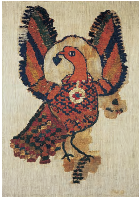
Stoff mit Adlermotiv, ägyptisch, 6./7. Jahrhundert

Das Ikonen-Museum Recklinghausen, das im Jahre 1956 eröffnet wurde, ist das bedeutendste Museum ostkirchlicher Kunst außerhalb der orthodoxen Länder.