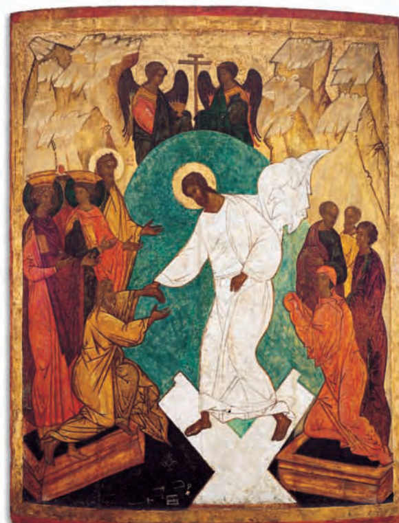
Christi Auferstehung (Höllenfahrt), russisch, Anfang 16. Jahrhundert

Le Département copte du Musée des Icônes documente par des œuvres remarquables la transition entre la fin de l'Antiquité païenne et les débuts du christianisme en Egypte. Des reliefs de bois et de pierre, des tissages, des verres, des bronzes et des croix ainsi que quelques portraits du Fayoum témoignent de la diversité des activités artistiques en Egypte du 1er siècle après J-C aux débuts du Moyen-Age.