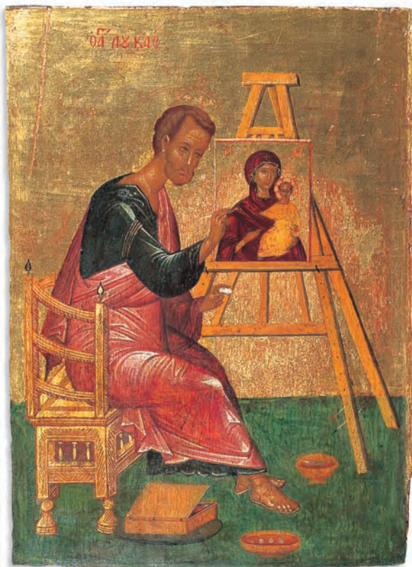
Lukas malt die Gottesmutter, griechisch (Kreta), Anfang 15. Jahrhundert

Le Musée des Icônes de Recklinghausen, inauguré en 1956, est le musée d'art religieux oriental le plus important situé hors des pays orthodoxes. Plus de 1000 icônes, des broderies, des miniatures, des objets travaillés dans le bois et le métal en provenance de la Russie, de la Grèce et d'autres pays balkans donnent un vaste aperçu de la diversité des thèmes ainsi que de l'évolution stylistique de la peinture des icônes et des arts mineurs dans le monde chrétien oriental. Une iconostase sculptée en bois donne une idée de la localisation des icônes dans les églises orthodoxes.