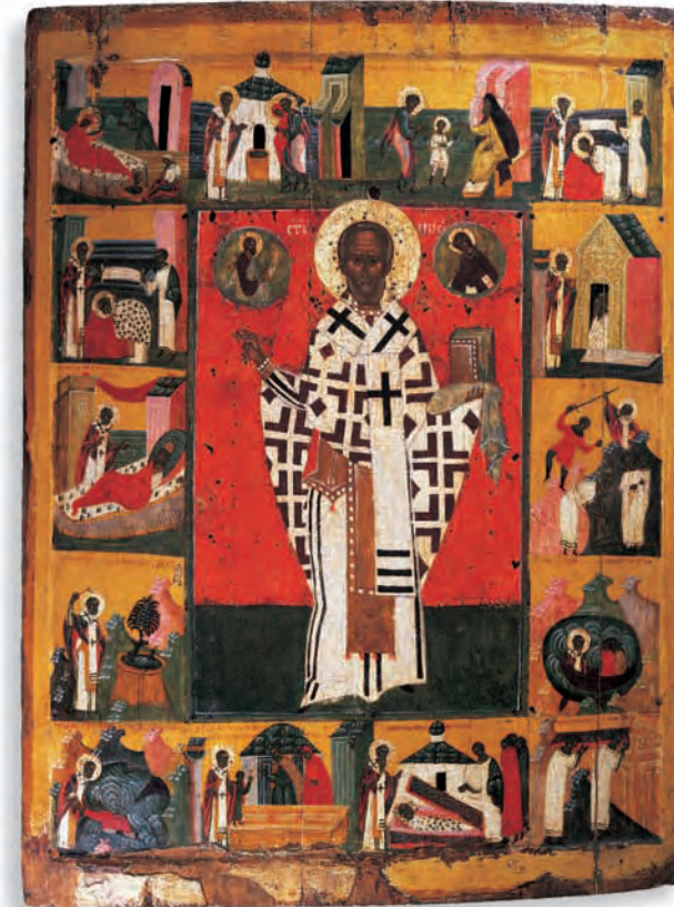
Nikolaus mit Vita, russisch (Nogorod), Ende 15. Jahrhundert

De Koptische afdeling van het Iconen-Museum documenteert de overgang van de heidense klassieke oudheid tot het begin van het christendom in Egypte met uitstekende kunstwerken. Reliëfs van hout en steen, weefsels, glazen, bronzes voorwerpen en kruizen, zoals ook enige portretten van mummies getuigen van de veelzijdigheid der artistieke werkzaamheden in Egypte van de 1 eeuw tot in het begin van de middeleeuwen.