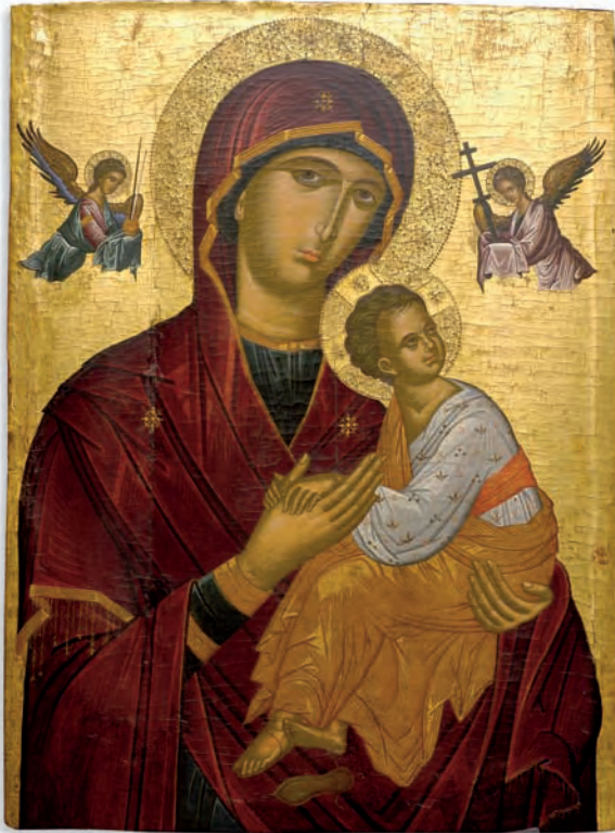
Gottesmutter der Passion, griechisch (Kreta), Ende 15. Jahrhundert